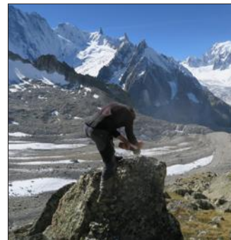
L'exposition au gel des roches est un marqueur.

C'est malheureusement cette trajectoire catastrophique qui semble vouloir se dessiner si rien n'est fait pour le contrecarrer. « Pour se maintenir dans le scénario le plus optimiste et une augmentation de la température globale en dessous de 2 °C, il faut que les émissions humaines de gaz à effet de serre baissent fortement avant 2030. Le CO2 que nous émettons aujourd'hui reste dans l'atmosphère, et donc la réchauffe, pendant 100 ans. Il faut agir maintenant pour le climat de demain », rabâche Benjamin Pohl qui ne semble