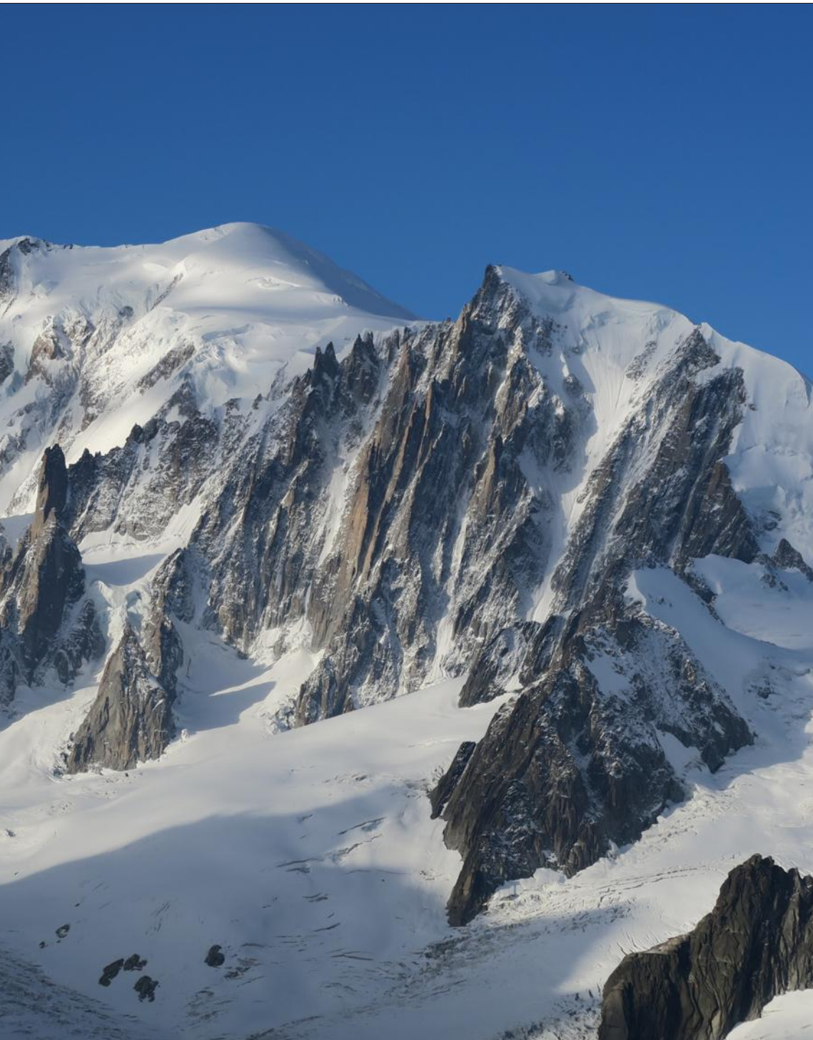
Toute la complexité du relief du mont Blanc est appréhendée par cette nouvelle technique.

“ Dans les alpes, d'ici la fin du siècle, il faudra monter à 3 000 m pour avoir de la neige et donc pouvoir skier ! ”